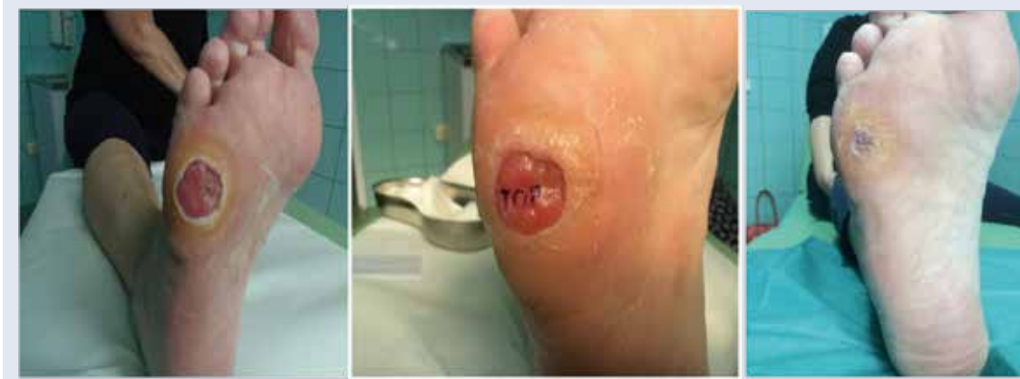
Obr. 3 | Instilácia Heberprotu-P do spodiny a okrajov dlhodobo sa nehojacej neuropatickej ulcerácie