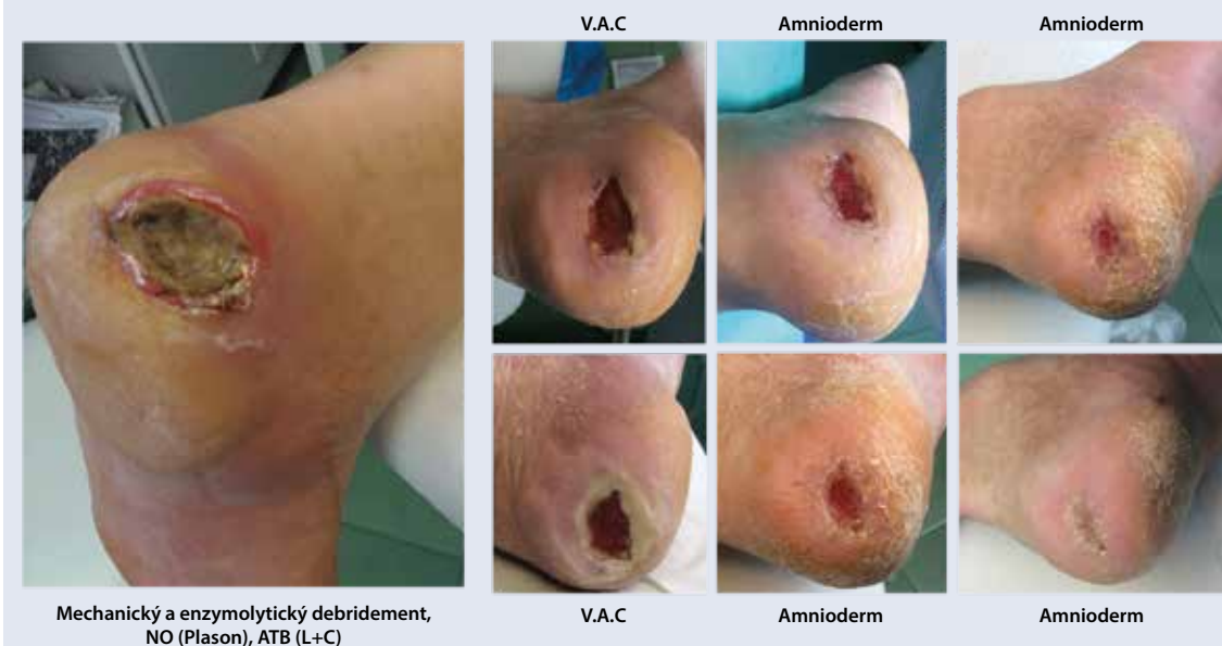
Obr. 2c | Liečba hojivou membránou Amnioderm. Stimulácia epitelizácie chronickej neuropatickej ulcerácie