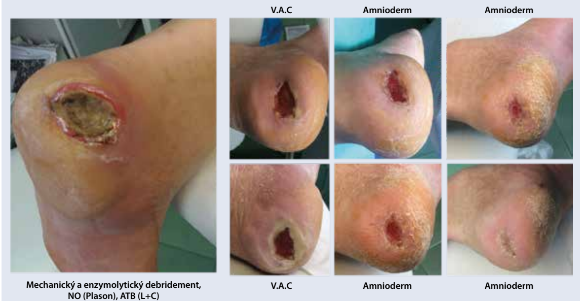
Obr. 2c | Liečba hojivou membránou Amnioderm. Stimulácia epitelizácie chronickej neuropatickej ulcerácie