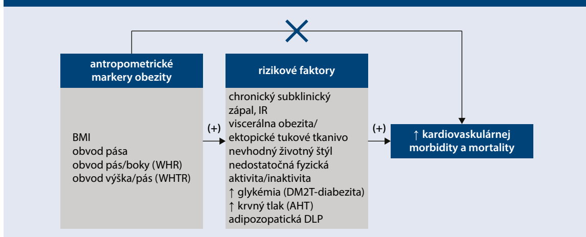
Schéma 1 | Vzťah medzi obezitou/diabetizou, rizikovými faktormi a nárastom KV-morbidity a mortality vo všeobecnej populácii. Upravene podľa [19]

AHT – artériová hypertenzia BMI – index telesnej hmotnosti/Body Mass Index, DLP – dyslipidémia DM2T – diabetes mellitus 2. typu IR – inzulínová rezistencia WHT – pomer pás-boky/Waist-Hip-Ratio WHTR – pomer pás-výška/Waist-to-Height Ratio