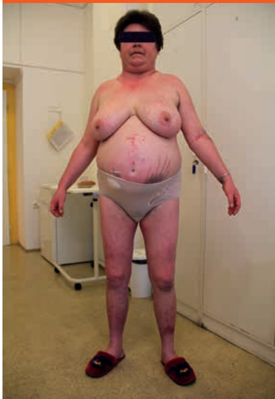
Obr. Habitus pacientky s Cushingovým syndromem.

Hlavním patogenetickým faktorem poruch metabolismu glukózy u CS jsou zvýšené cirkulující koncentrace kortizolu, které interferují s glukózovým metabolismem na řadě úrovní. Pankreatické beta-buňky na svém povrchu exprimují glukokortikoidní receptory a bylo prokázáno, že glukokortikoidy vedou k jejich dysfunkci. Konkrétně dochází k alteraci vychytávání glukózy beta-buňkami a k poruše metabolismu glukózy v nich a následně k poruše exocytóze sekrečních granul obsahujících inzulin [14]. Krátkodobé podávání glukokortikoidů vede rovněž ke snížení inzulinotropního účinku GLP1 (glucagon-like peptide 1) [15]. Hlavním mechanismem rozvoje glukózové intolerance a DM u CS je glukokortikoidy indukovaná inzulinová rezistence periferních tkání, zejména pak v játrech, přičně pruhované svalové a tukové tkáni. Ve svalové a tukové tkáni kortizol vede postreceptorovým mechanismem k alteraci všech účinků inzulinu. V játrech dochází účinkem glukokortikoidů ke zvýšení glukoneogeneze a glykogenolýzy, ve svalové a tukové tkáni dochází ke snížení vychytávání a metabolismu glukózy, v tukové tkáni dochází navíc ke zvýšení lipolýzy a uvolňování volných mastných kyselin do oběhu [16]. Kromě uvedených účinků kortizol moduluje expresi a aktivitu některých adipokinů, např. adiponektinu, leptinu, rezistinu a apelinu, a prostřednictvím nich rovněž ovlivňuje inzulinovou senzitivitu. Shrnutí základních patofyziologických mechanismů poruchy glukózo-