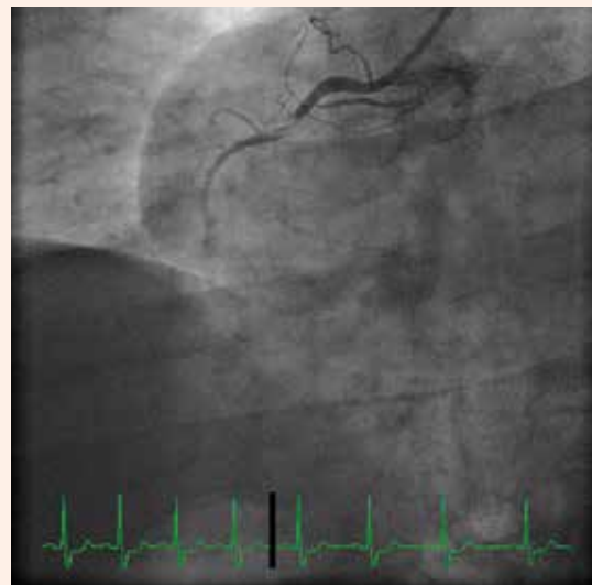
Obr. 5. Hemodynamicky významná tandemová stenóza RIA.