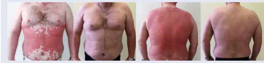
Obr. 2 | Pacient s metabolickým syndrómom s ťažkou formou psoriázy pred liečbou a po 3 mesiacoch liečby preparátom skupiny anti-TNF \alpha – adalimumabom