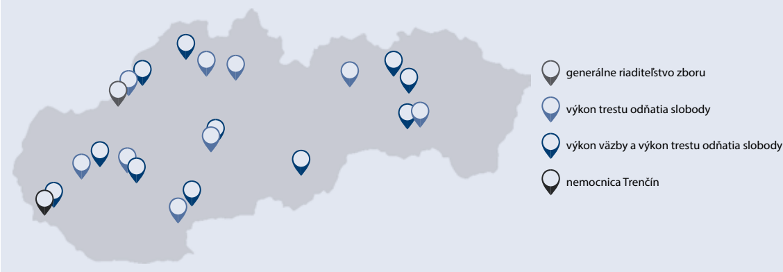
organizačné zložky zboru väzenskej a justičnej stráže