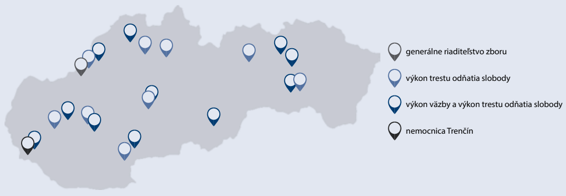
organizačné zložky zboru väzenskej a justičnej stráže